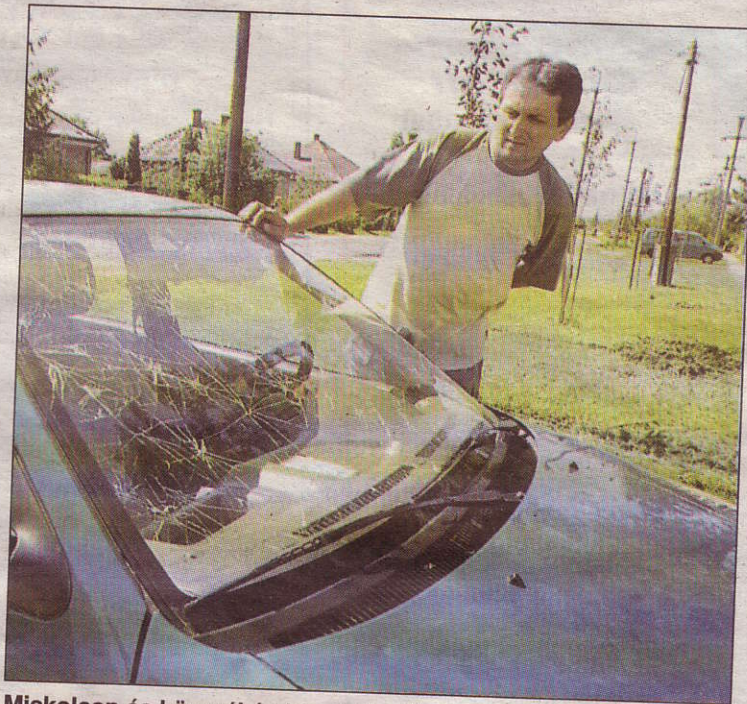
Miskolcon és környékén kíméletlenül elverte a jégeső az autokat