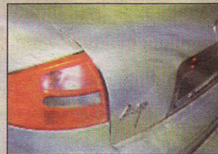
Elsímították a problémát